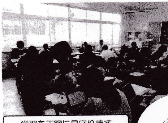
学習を丁寧に見守ります