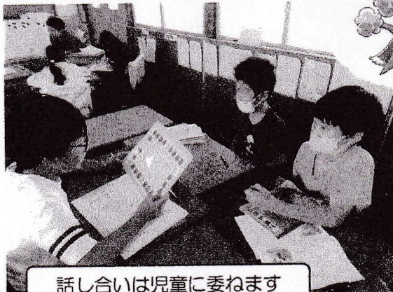
話し合いは児童に委ねます