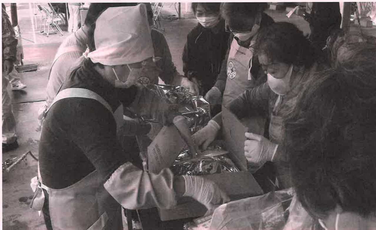
炊き出し訓練を行う地域奉仕団