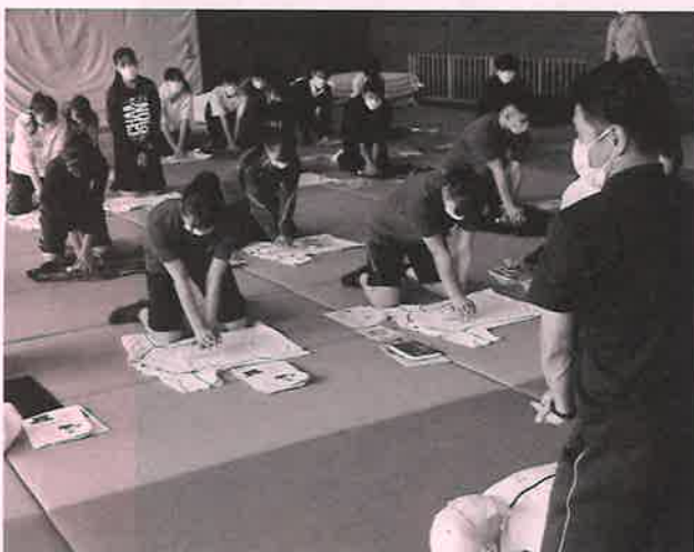
ペットボトルを用いて心肺蘇生を学ぶ 青少年赤十字メンバー