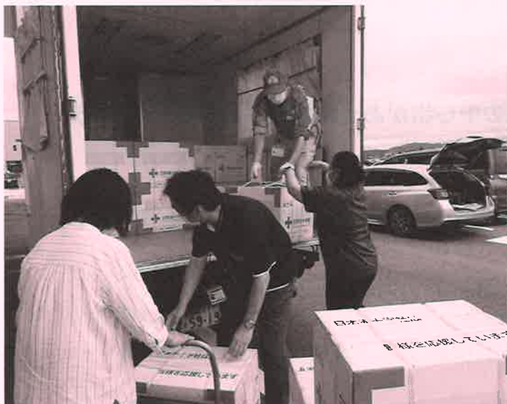
救援物資を搬送する職員

また、今後、発生が危惧されている南海トラフ地震や首都直下地震等の大規模災害などに備え、災害対応能力と救護体制の強化のため、医療チームの訓練・研修を実施するとともに、救護活動に必要な資機材等の充実も図っています。