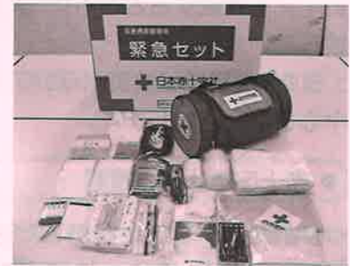
緊急セット (日用品のセット)