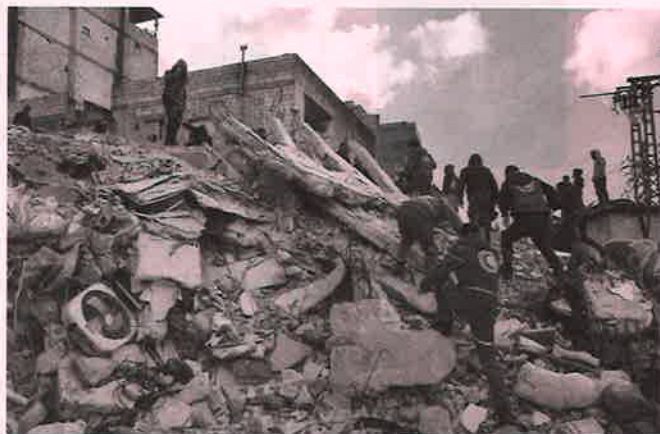
被災地で捜索・救助活動を行うシリア赤新月社スタッフ