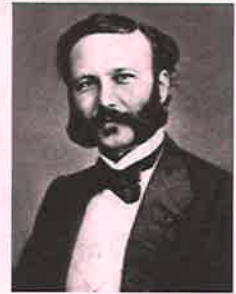
アンリー・デュナン