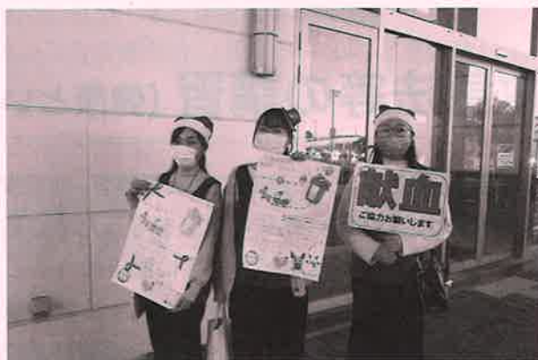
献血の協力呼びかけを行う青年奉仕団