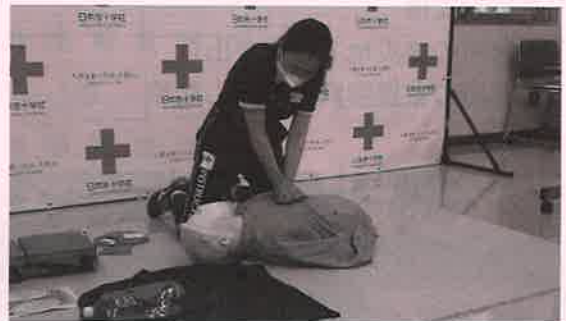
オンライン救急法講習

コロナ禍であっても、「いのちと健康を守る知識と技術」の普及は重要な社会課題であることから、当支部では、感染予防に配慮した講習やオンラインを活用した講習を実施しています。