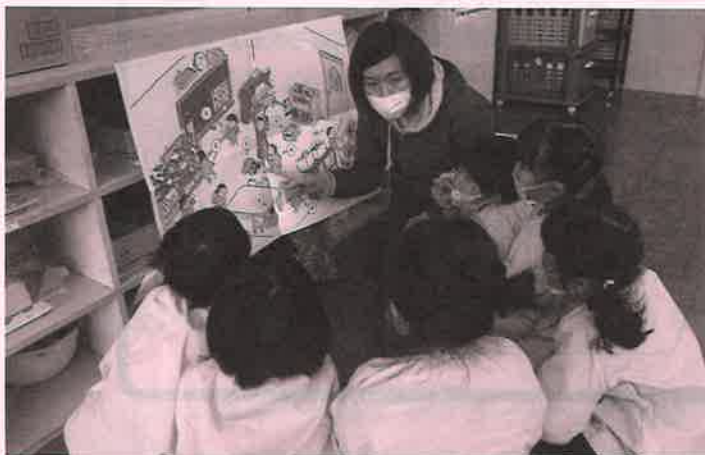
「まちがいさがし」で身を守る方法を学ぶ子どもたち

・幼稚園、保育所の子どもたちに災害時の危険（場所・行動）について伝え、自分の身を守るための基礎的な知識や判断力を身に付けてもらうことを目指した防災教材です。