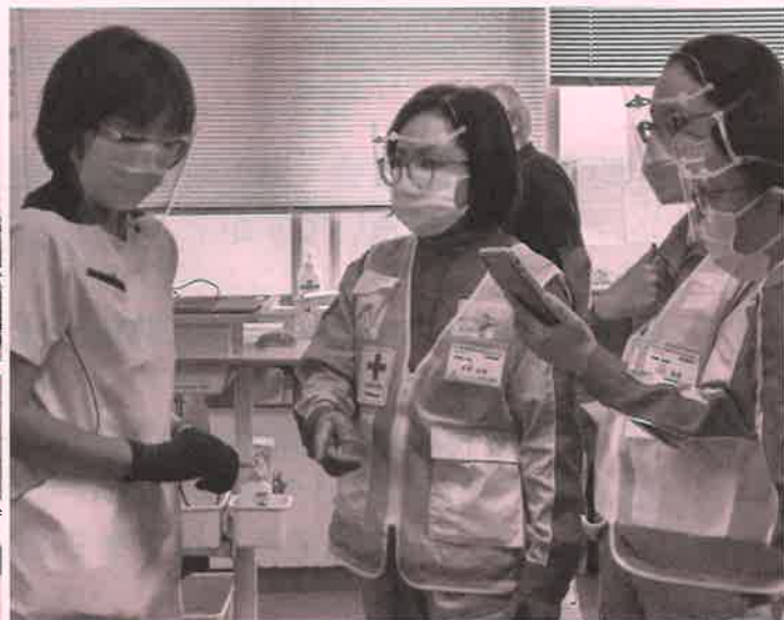
医療支援を行う医療チーム