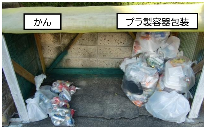
集積所内での分け方の例

※プラ製容器包装とかんは別々の車で収集しているため、時間帯によって集積所内に片方のみ残っている場合がありますが、当日中には全て収集を行います。