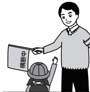
つくば市長 五十嵐立青