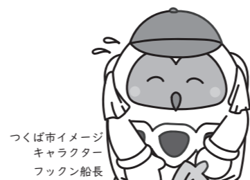
つくば市イメージキャラクター フックン船長