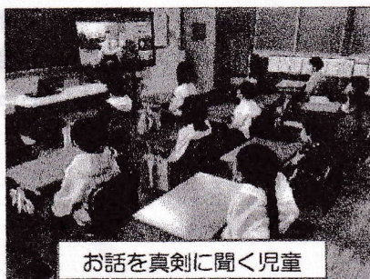
お話を真剣に聞く児童