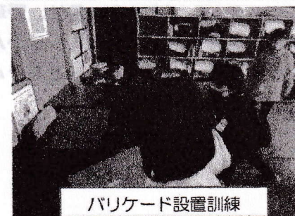
バリケード設置訓練