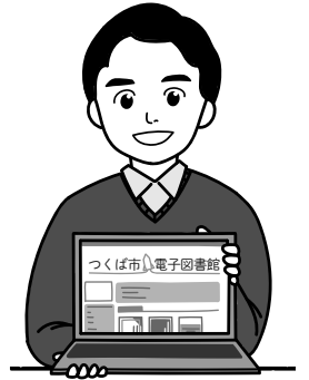
つくば市長 五十嵐立青