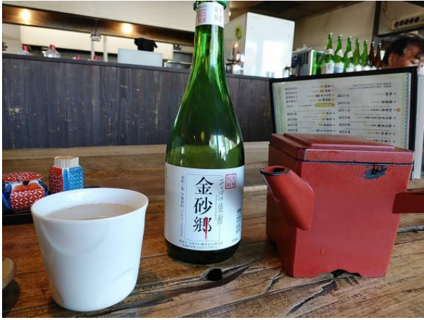
そば焼酎金砂郷の蕎麦湯割

ただ、お酒を飲まれる方はこんな飲み方は如何でしょうか。そば焼酎の蕎麦湯割、お酒を飲んでも何となく健康的な感じになりませんか。