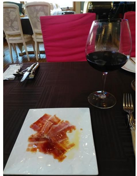
生ハムと赤ワイン

ただ、お酒を飲まれる方はまずは生ハムで赤ワインは如何でしょうか。運が良ければ美味しいチーズもあります。