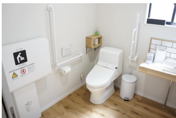
車イス対応トイレ