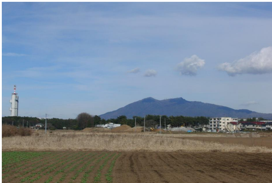
初春 花畑・筑波山を望む

新年あけましておめでとうございます！！ 会員の皆様には旧年中より自治会活動にご支援、ご協力を頂きありがとうございました。花畑を綺麗で生き生きとした地域にするためにこれからも皆様のご支援、ご協力をお願い致します。昨年は、猛暑の中、夏祭り、花壇への花植えと水遣りにご尽力頂いた方々、また防災訓練、側溝清掃、餅つき大会にご参加、ご協力頂いた方々ありがとうございました。今年度もあと3カ月となり寒い季節ですが花畑総会に向けて役員全員最後まで頑張り