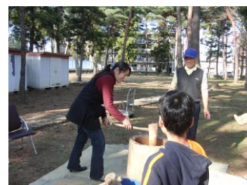
おかあさんも力持ち！