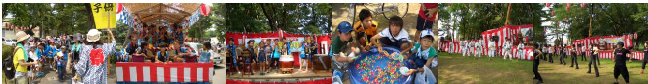
お御輿いざ出発!!! お囃子会祭り太鼓 面白い? 少林寺拳法 ジャジャサイズダンス

来年からもこの形を続けていきたいと思いますが、シンプルな形が実施してみて成功したのではないかと再確認しました、今後各位のご意見を聞いてより楽しい祭りとしていきたいと思っています。